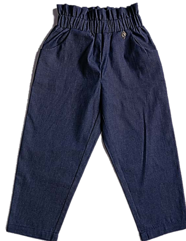
М-112-1(джинс хлопок 100%)