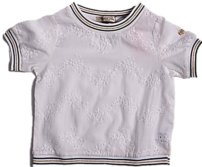
М-95-19 (подвяз золото, шитье хлопок 100%)