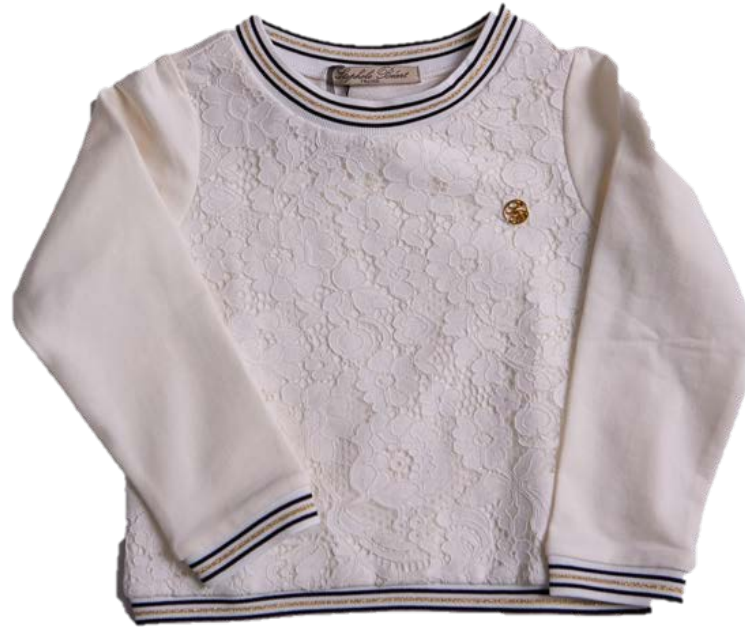
М-94 (кружево, подвяз золото)