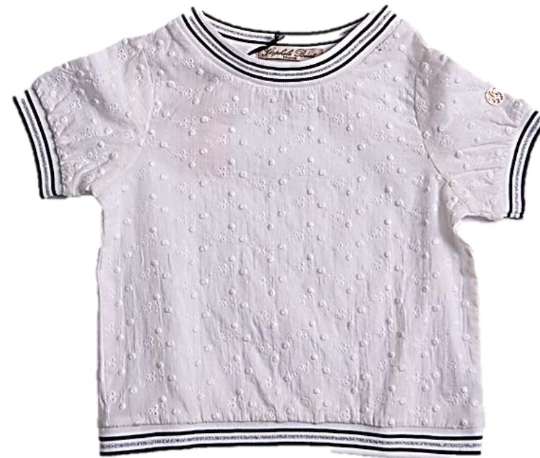
М-95-2 (подвяз серебро, шитье 100%)