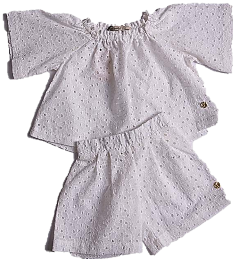
M-69.99 (шитье хлопок 100%)