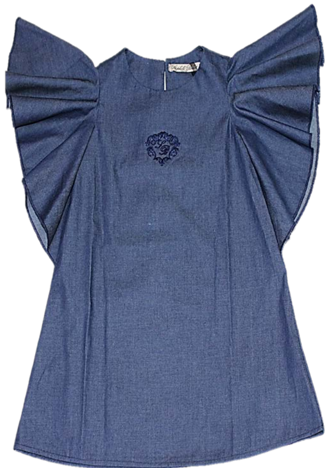
М-109-1(джинс хлопок 100%)