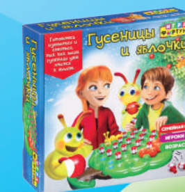
Ф98390 «Гусеницы и яблочки»