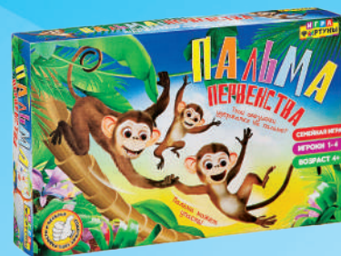
Ф77175 «Пальма первенства»