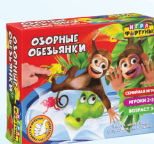
Ф94957 «Озорные обезьянки»