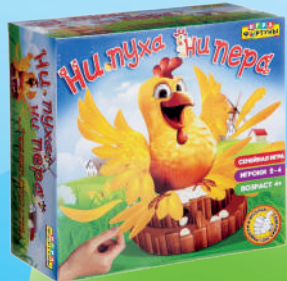
Ф77077 «Ни пуха ни пера»