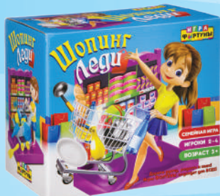
Ф93362 «Шопинг леди»