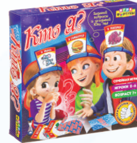
Ф86077 ХИТ! «Кто я?»