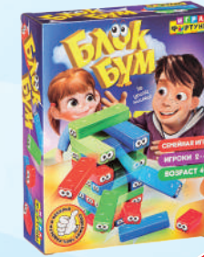
Ф79326 ХИТ! «Блок Бум»