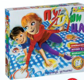
Ф85269 ХИТ! «Путаница»