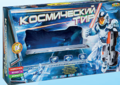
Ф86080 «Космический тир»