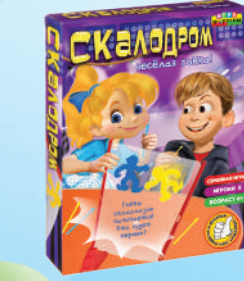
Ф86078 «Скалодром, весёлая гонка»