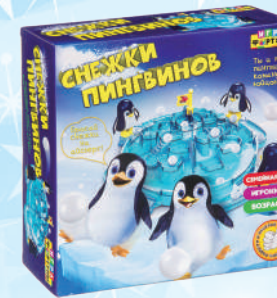
Ф98386 «Снежки пингинов»