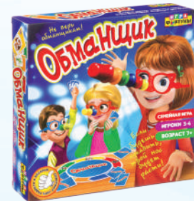
Ф71779 ХИТ! «Обманщик»