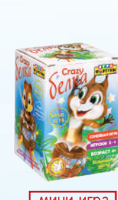
мини-игра Ф94300 ХИТ! «CRAZY белка» мини-игра