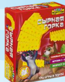
Ф96995 «Сырная горка»