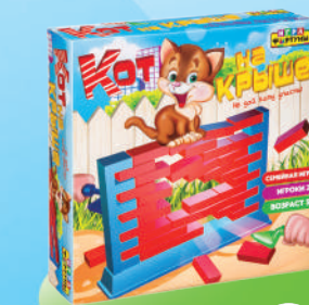
Ф71778 ХИТ! «Кот на крыше»