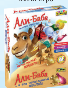
Ф51233 «Али Баба и непослушный верблюд»