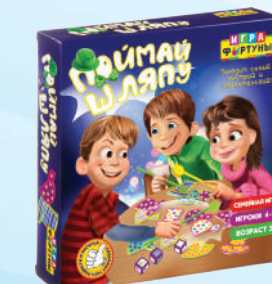
Ф93363 «Поймай шляпу»