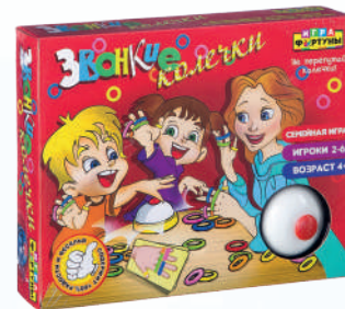
Ф85270 «Звонкие колечки»