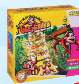
Ф51234 ХИТ! «Кувыркающиеся обезьянки»