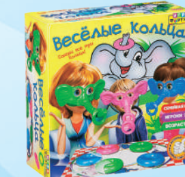
Ф77176 «Весёлые кольца»