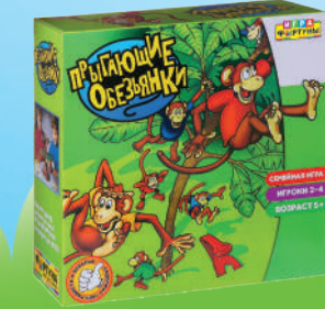
Ф51236 «Прыгающие обезьянки»