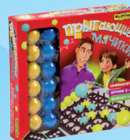
Ф78219 «Прыгающие мячики»