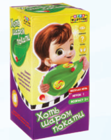
Ф93365 «Хоть шаром покати»