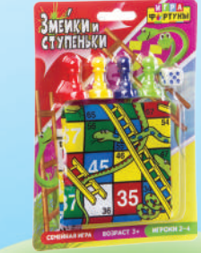
Ф94952 «Змейки и ступеньки»