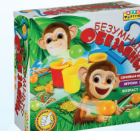
Ф86180 «Две безумные обезьяны»