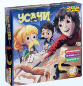
Ф77076 ХИТ! «Усачи»