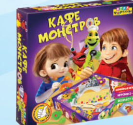
Ф95683 «Кафе монстров»