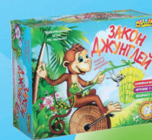
Ф72417 «Закон джунглей»