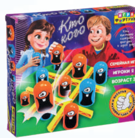
Ф86618 «Кто кого»