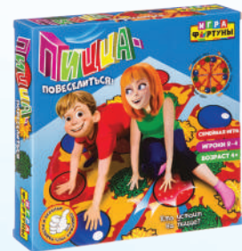
Ф94604 ХИТ! «Пицца-повеселиться!»