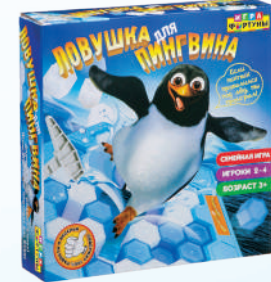
Ф77172 ХИТ! «Ловушка для пингвина»