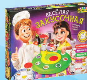
Ф79325 «Весёлая закусочная»