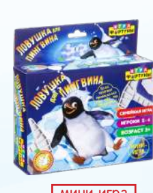
мини-игра Ф93553 «Ловушка для пингвина» мини-игра