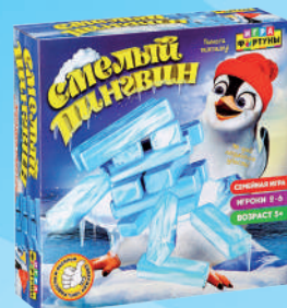
Ф79327 «Смелый пингвин»