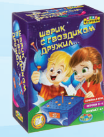
Ф93361 «Шарик с гвоздиком дружил»