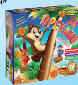
Ф72332 «За орехами»