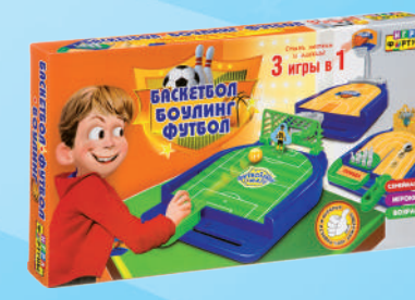
Ф97798 «3в1. Футбол, боулинг, баскетбол»