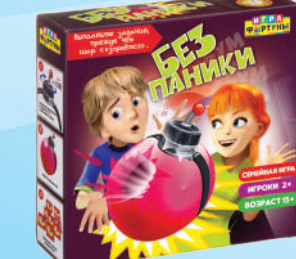
Ф95310 «Без паники»