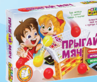
Ф97797 «Прыгай мяч»