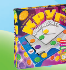
Ф77177 «Круг в квадрате»