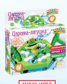
мини-игра Ф93554 ХИТ! «Царевна-лягушка» мини-игра