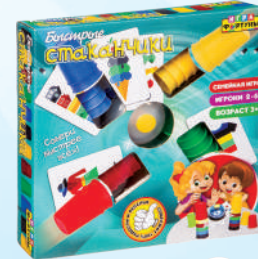
Ф86079 ХИТ! «Быстрые стаканчики»