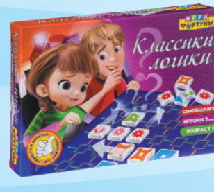
Ф94955 «Классики логики»