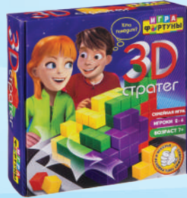
Ф94954 «3D стратег»