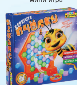
Ф77171 «Берегите пчёлку»