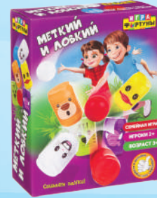
Ф94956 «Меткий и ловкий»