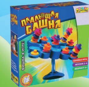
Ф51235 «Падающая башня»