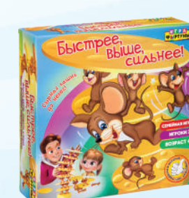
Ф71777 «Быстрее, выше, сильнее!»