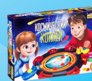
Ф98389 «Космический хоккей»