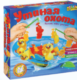
Ф87006 «Утиная охота»