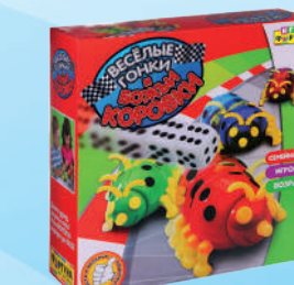
Ф51239 «Весёлые гонки и божи коровки»