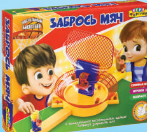
Ф95311 «Забрось мяч»