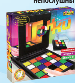
Ф78221 «Гонки по цветовому коду»