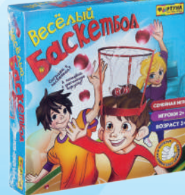
Ф84961 «Весёлый баскетбол»