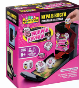
Ф93358 «Мокрая курица»