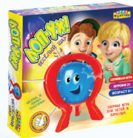
Ф68000 ХИТ! «ЛОП-УХ Весёлый шар!»