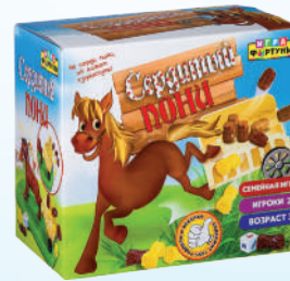
Ф85510 «Сердитый пони»