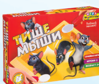
Ф94482 «Тише мыши»