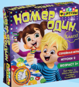
Ф86617 «Номер один»