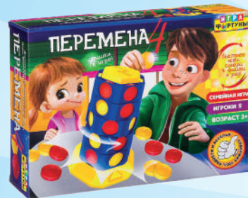
Ф86619 «4 Перемена»