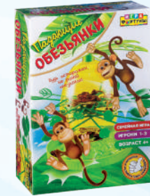
Ф85271 «Падающие обезьянки»