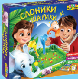
Ф95666 «Слоники и шарик»