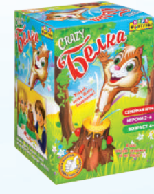
Ф70000 «CRAZY белка»