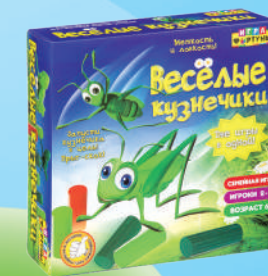
Ф98388 «Весёлые кузнечики»