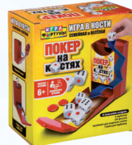
Ф93359 «Покер на костях»